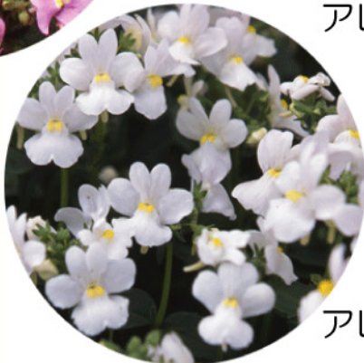
アレンジ ホワイト