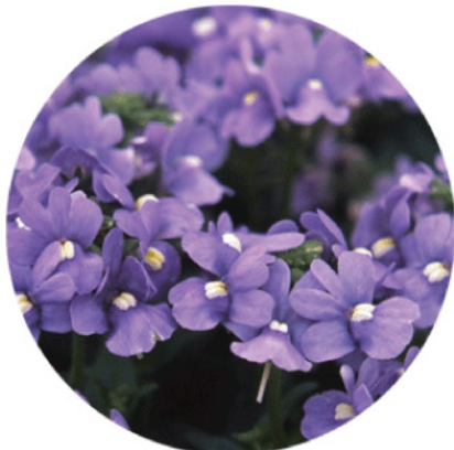
アレンジ ラベンダー