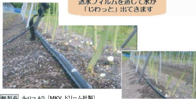
新製品 キリコAD (MKV ドリーム社製) 面ですっきりムラなく灌水(面給液型チューブ) 1本100m巻(1梱包10本入;水量は圧で調節可)