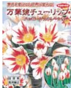
ハッピージェネレーション