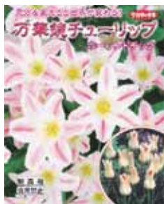
ホーランドチック