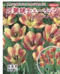
カラーミスティック